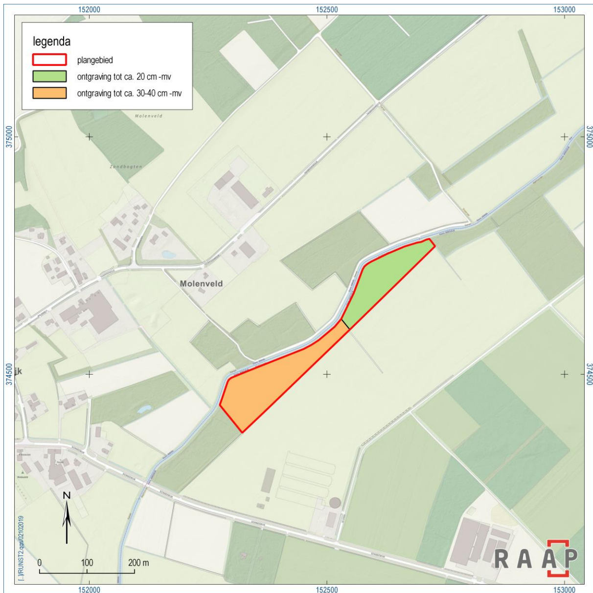
Figuur 2. Kaart waarop de ontgravingsdieptes zijn aangegeven.

Vanwege de onbekende archeologische verwachting op zogenaamde beekdalgerelateerde vindplaatsen, alsook de aard van de werkzaamheden (maaiveldverlaging van circa 20 cm in het noordelijk deel van het plangebied en circa 40 cm in het zuidelijk deel van het plangebied), wordt in eerste instantie uitgegaan van een laagdrempelig archeologisch onderzoek, een archeologische inspectie (extensieve archeologische begeleiding (zie figuur 2).