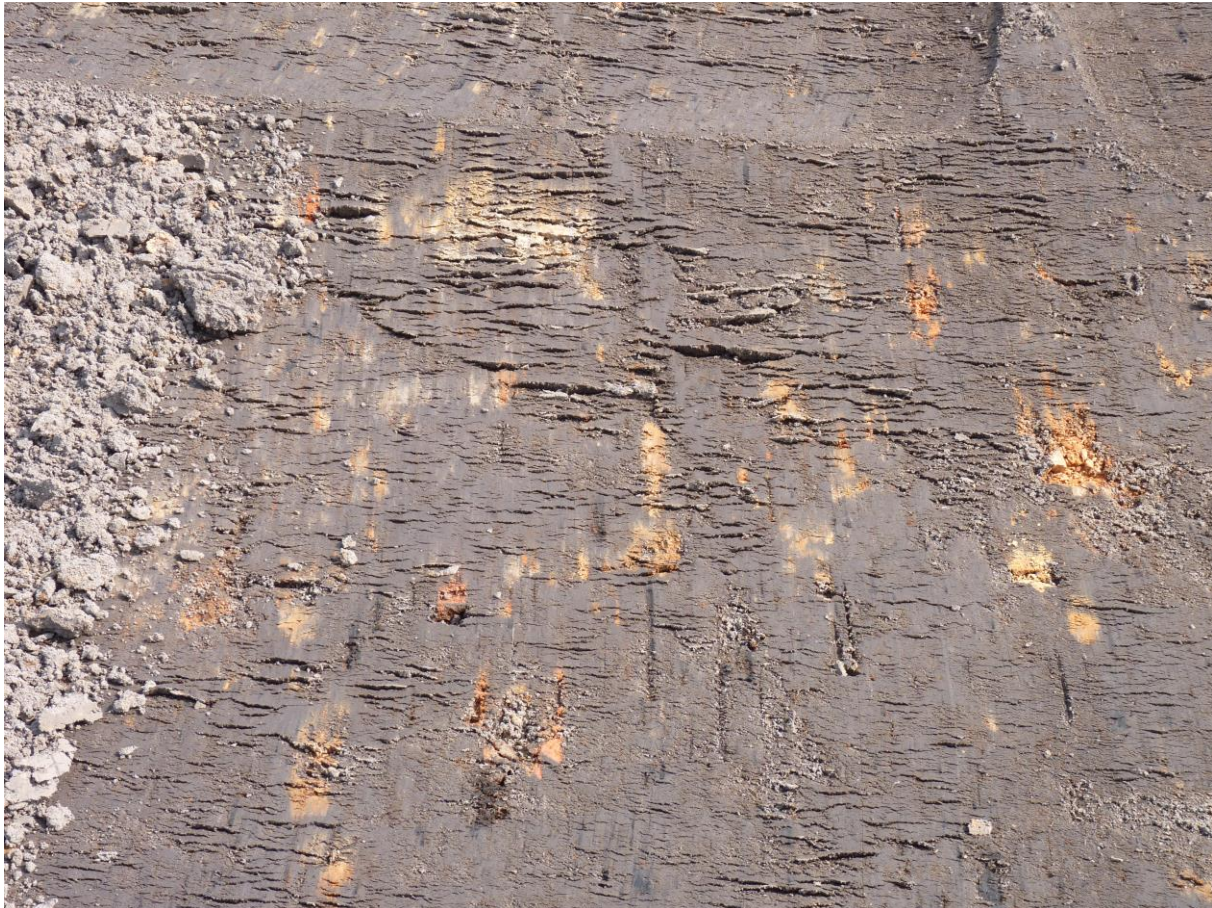
Figuur 5. Baksteenfragmenten en verbrande leembrokjes die in het ontgraven vlak zijn aangetroffen.

Dit waren primitieve, niet plaatsvaste ovens die in de regel werden gebouwd op de hoge oever, in de directe nabijheid van de plaats waar het leem werd gewonnen (Roymans, 2005). De ovens waren niet voorzien van een fundament en vaak niet groter dan 10 m 2 en circa 2 m hoog.