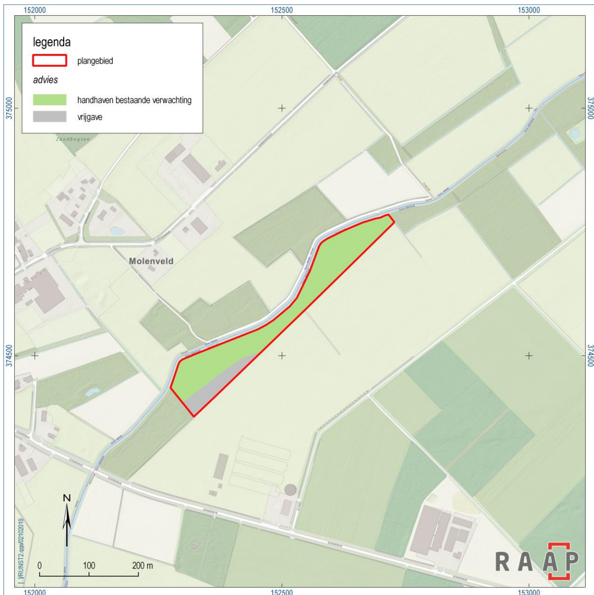
Figuur 7. Advieskaart.

Tijdens de archeologische begeleiding zijn er twee Engelse vliegtuigbommen gevonden. Hoogstwaarschijnlijk moeten de bommen in verband worden gebracht met van een Lancaster die in de nacht van 21 op 22 juni 1944 op de Walikerheide is neergestort. Het is aannemelijk dat er meerdere bommen in de ondergrond aanwezig zijn. Omdat in de nabije toekomst nog een nieuwe bedding van de Run wordt aangelegd, wordt aanbevolen vooraf een OCE-onderzoek uit te laten voeren.