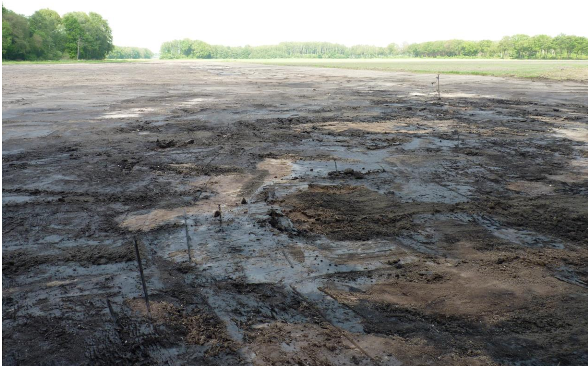
Figuur 4. Foto van de aangetroffen bodemprofielen in het horizontale vlak na ontgraving. Links: veraard veenpakket; rechts: Formatie van Sterksel met daarop plaatselijk nog restanten van veraard veen.

Het oostelijk deel van het plangebied, richting de hoge oeverzone van de Run, neemt de dikte van de moerige veenlaag snel af en is in het meest oostelijke deel van het plangebied bijna geheel verdwenen. Het bodemprofiel in deze oeverzone wordt getypeerd door een bouwvoor op de formatie van Sterksel waarin plaatselijk nog restanten van de veraarde veenlaag aanwezig zijn (figuur 4).