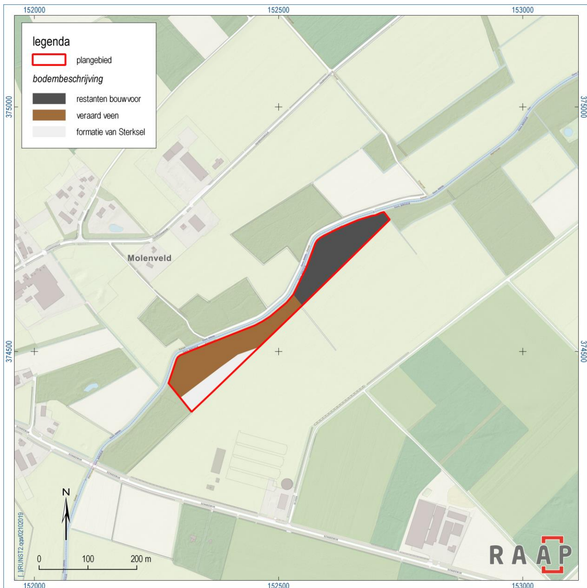
Figuur 3. Overzicht van de aangetroffen bodemprofiel na ontgraving.

De bouwvoor bestaat uit humeus zand en is opgebracht met als doel het agrarisch gebruik van de lage beekdalbodem te verbeteren door deze op te hogen met zand.