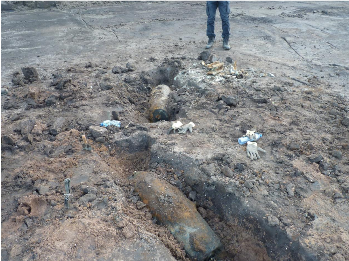
Figuur 6. De twee bommen en een deel van het afwerpmechanisme (rechtsboven) van de Lancaster die tijdens de graafwerkzaamheden zijn aangetroffen.

Gewoonlijk bestond de lading van een Lancasterbommenwerper uit een mix van brand- en brisantbommen, bedoeld om een felle brand te veroorzaken. In totaal waren 16 500 ponders en één 400 pondeur aan boord van het vliegtuig. Het aantal op de luchtfoto van 1944 zichtbare bomkraters en de twee tijdens de archeologische begeleiding aangetroffen bommen, dekt niet de lading van het in de Lancaster aanwezige bommenarsenaal. Dit gegeven maakt het zeer aannemelijk dat in het plangebied en in de directe omgeving daarvan, nog niet ontplofte bommen aanwezig zijn.