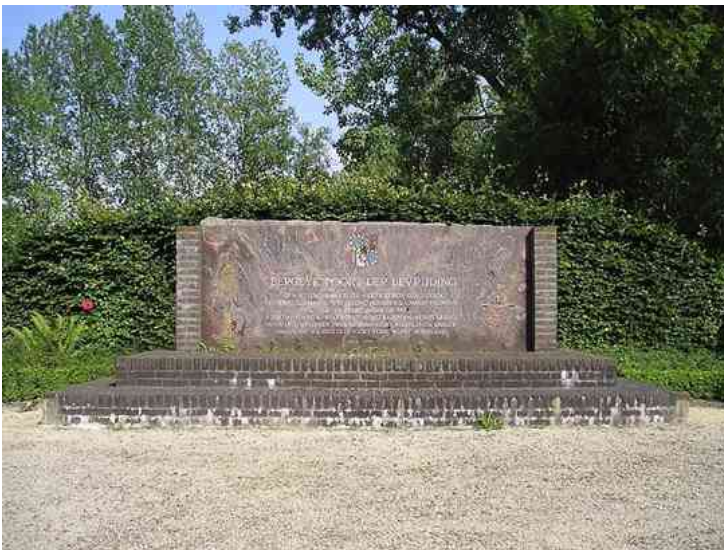
Oorlogsmonument. In 1994 geplaatst nabij grens Bergeijk – Lommel